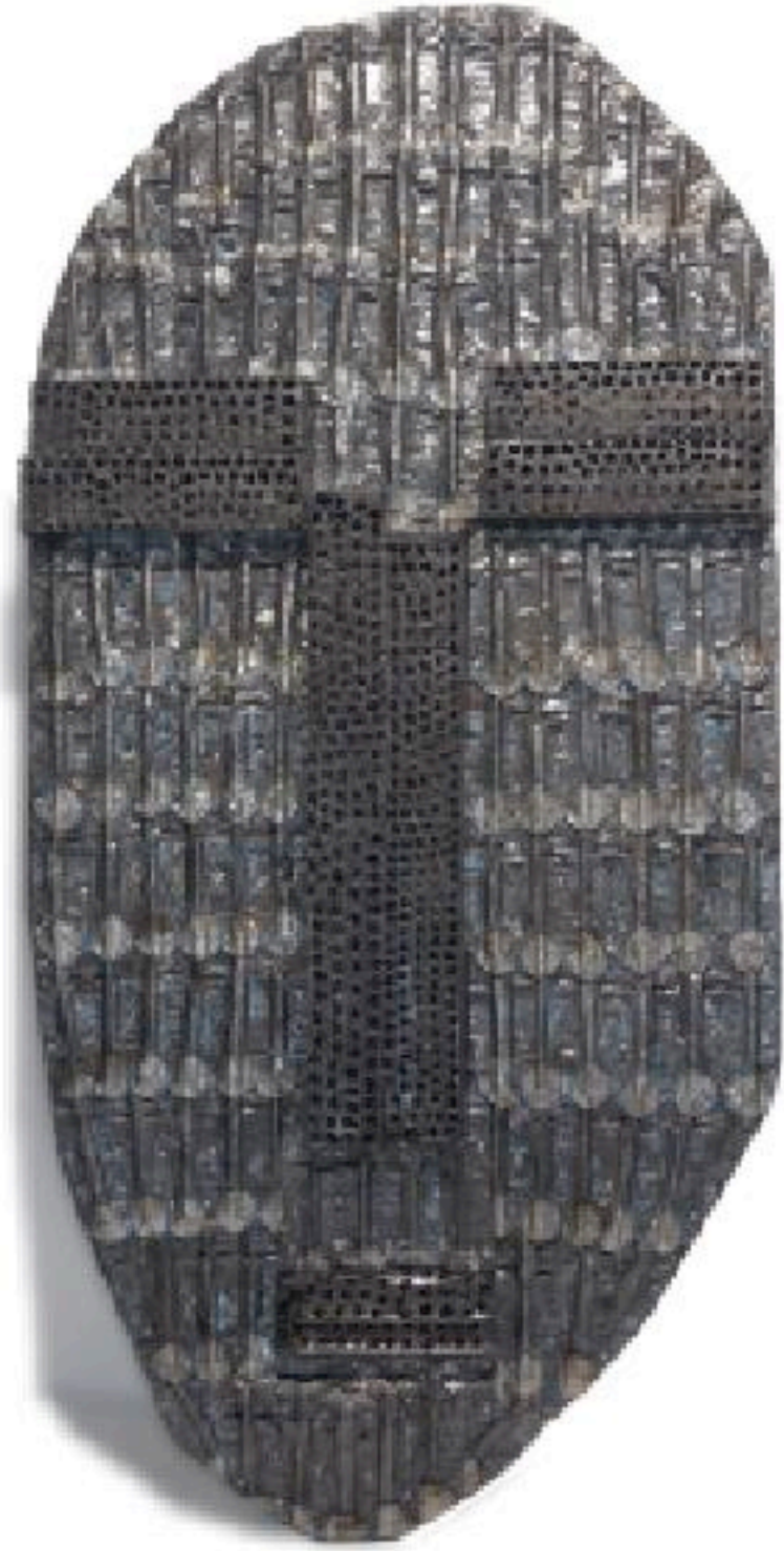
القناع ٨ - The Mask VIII